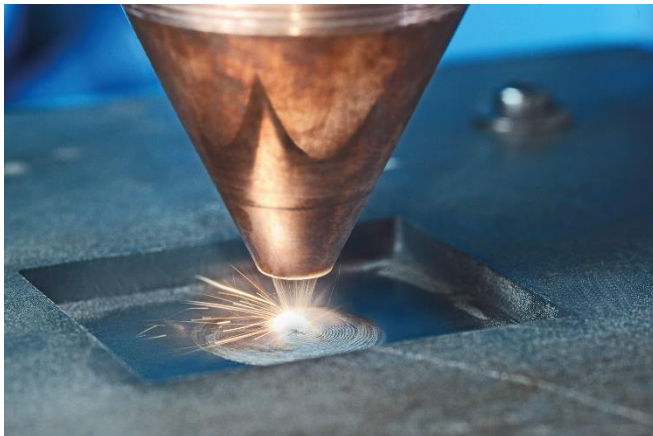
Bild 1: Das Projekt LAVAL soll das Laserauftragschweißen zu einer prozesssicheren Technik weiterentwickeln, mit der sich Blechhalbzeuge gezielt lokal verstärken lassen.