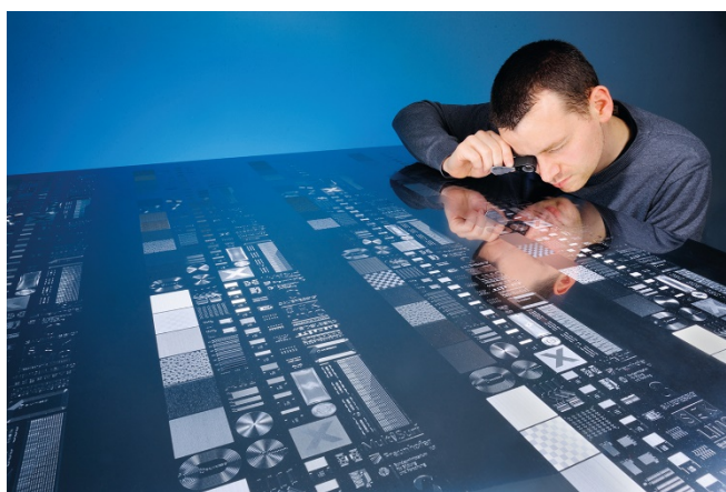
Bild 2: Großformatige (1m x 1,5 m) Prägeplatte, die mit dem neuen Multistrahl-graviersystem erzeugt wurde.

PRESSEINFORMATION 9. Oktober 2020 || Seite 3 | 3