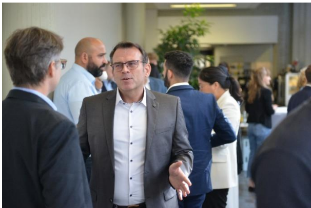
Bild 2: Das Laser Colloquium Hydrogen bietet viel Raum für Networking und Wissensaustausch. Fachliche Themen werden in den Pausen vertieft und neue Kontakte geknüpft.