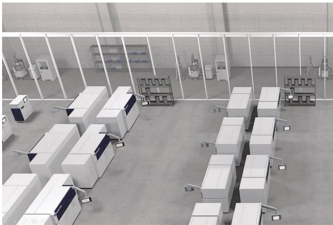
Bild 1: Additive Manufacturing Fabrikkonzept der Zukunft.