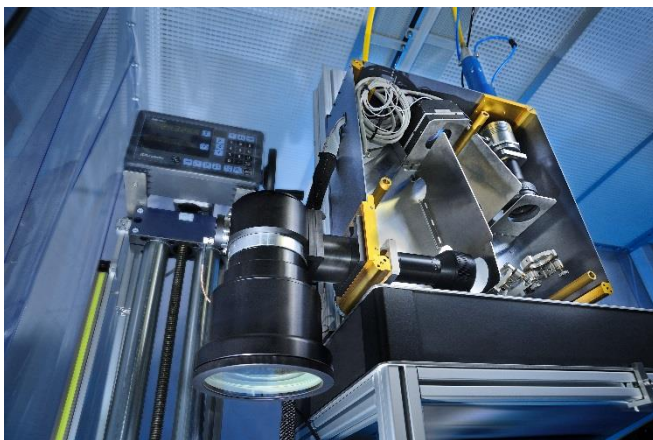
Bild 3: Aufbau für die laserbasierte Oberflächenbearbeitung mit den in ultraSURFACE entwickelten Technologien.

Die Fraunhofer-Gesellschaft ist die führende Organisation für angewandte Forschung in Europa. Unter ihrem Dach arbeiten 72 Institute und Forschungseinrichtungen an Standorten in ganz Deutschland. Mehr als 25 000 Mitarbeiterinnen und Mitarbeiter erzielen das jährliche Forschungsvolumen von 2,3 Milliarden Euro. Davon fallen knapp 2 Milliarden Euro auf den Leistungsbereich Vertragsforschung. Rund 70 Prozent dieses Leistungsbereichs erwirtschaftet die Fraunhofer-Gesellschaft mit Aufträgen aus der Industrie und mit öffentlich finanzierten Forschungsprojekten. Internationale Kooperationen mit exzellenten Forschungspartnern und innovativen Unternehmen weltweit sorgen für einen direkten Zugang zu den wichtigsten gegenwärtigen und zukünftigen Wissenschafts- und Wirtschaftsräumen.